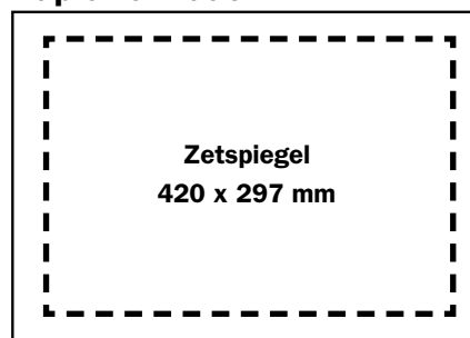
voorbeeld A3 pagina liggend - 420 x 297 mm